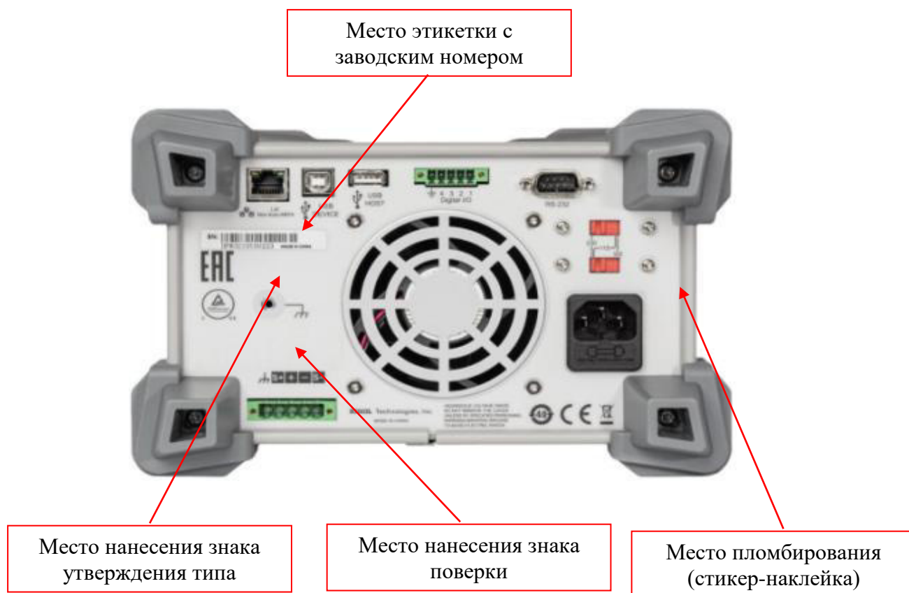
Рисунок 2 - Задняя панель источников модификаций DP811/DP811A, DP813/DP813A